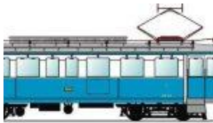
tipologie AB 01 - AB 02 - AB 03 ...lo l'AB 01 (malridotta) e ...l'AB 03 (restaurata e fu

Foto assai interessante, trovata sul sito STAGNI WEB e che ritrae il trenino biancazzurro della fu ferrovia SAN MARINO – RIMINI all'uscita della Galleria CERBAIOLA nei pressi del cimitero di DOMAGNANO