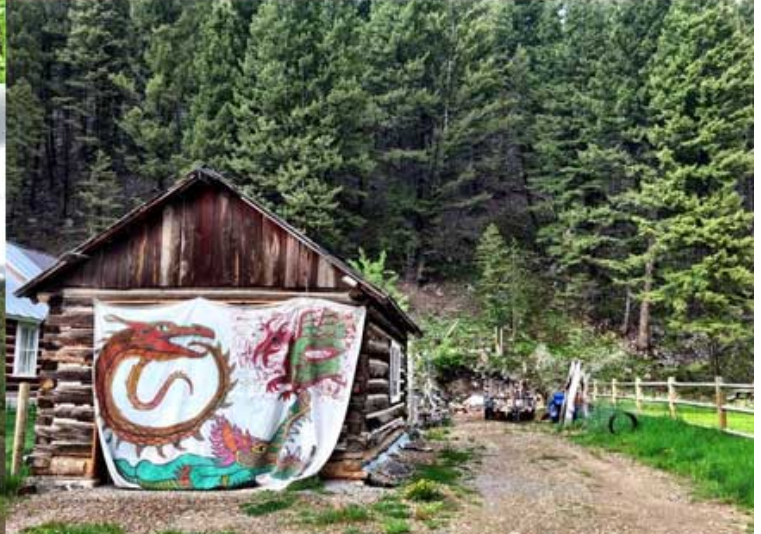
Rimini nel Montana, USA