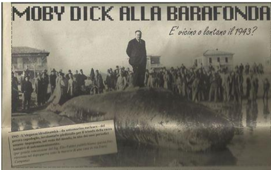
Capodoglio a Rimini